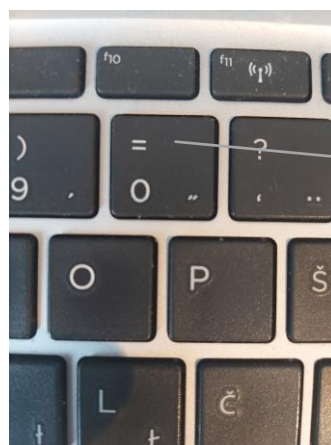
Slika 1- v i učbeniku uporabiš znak na tipkovnici < ,