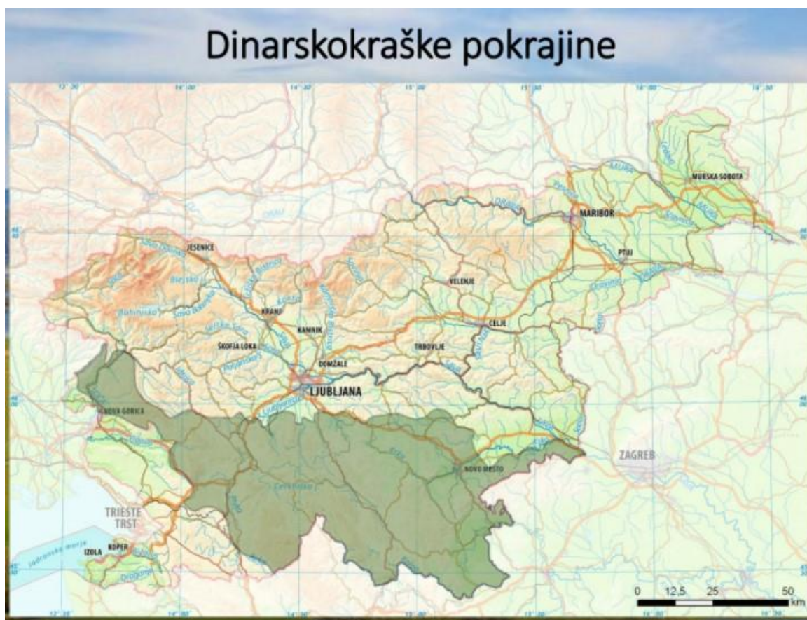
Figure 1: Zemljevid 1