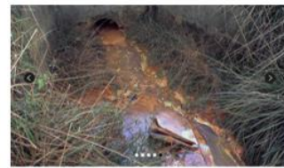
Slabša voda, onesnažena s težkimi kovinami: slaboživa kmetija predindustrijske industrije