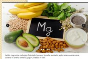
Veliko magnezija vsebujejo: špenat, karoten, špenat, avokado, ajda, sezamovo seme, mleko in lanena semena, jajca, oreščki in fižol.