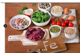
Železo v vsakdanjem življenju: klobase, jajca, špenat, oreščki, fižol, morski sadeži, pivo, mleko, čokolada in paradižnik.