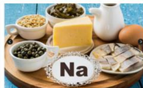
Sladkor, in vsebujejo tudi, so morske alge, kvas, jogurt, sira in mleko in jajca.