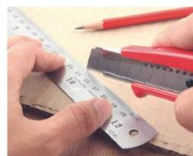
Nož za karton