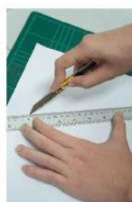
Nož za papir