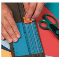
Nož z rezilnim kolesčkom