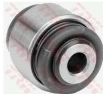
TRW PUŠA VILICE PUSA VILIC: ... euroton.si