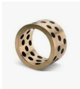
Drsni ležaji | Altes altes.si