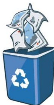
Papir in karton