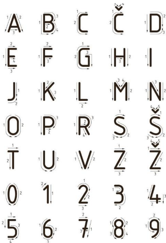
Pravilne poteze tehnične pisave